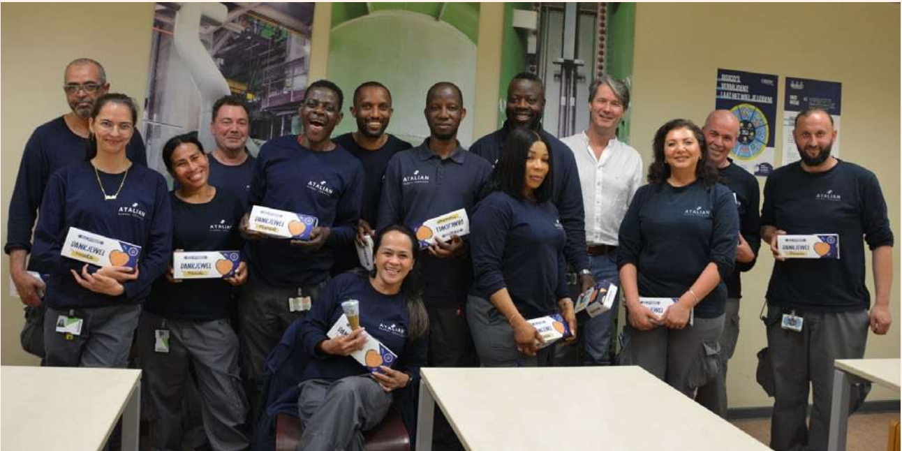
Het Atalian-team tijdens de Dag van het Schoonmaakpersoneel. Als blijk van waardering kreeg iedereen een gepersonaliseerd geschenk.